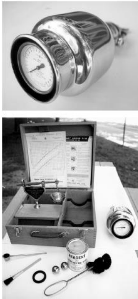
Hình 1 – Bình âm kế sử dụng khí tạo ra do Cácbua canxi