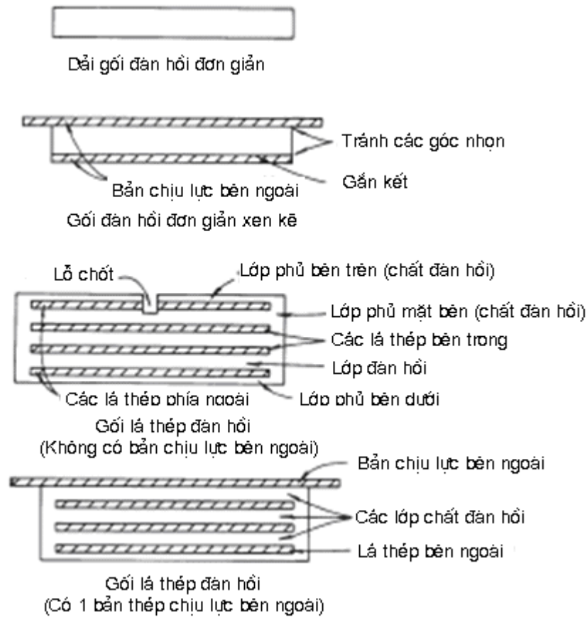
Hình 1 – Ví dụ cấu tạo của gối cao su